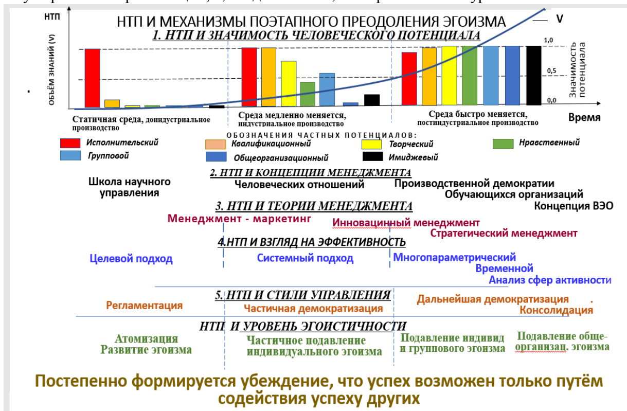
Рис. 1. Тенденции развития теории и практики управления организациями под воздействием НТП

Таким образом, внедрение достижений НТП в условиях конкурентной среды способствует поэтапному преодолению эгоизма индивидуального, группового, и, далее, эгоизма организаций в целом. Игнорирование задач формирования условий и стимулов для преодоления эгоизма делает практически невозможным преодоление рукотворных барьеров на пути развития организаций, а, следовательно, и сохранение конкурентоспособности.