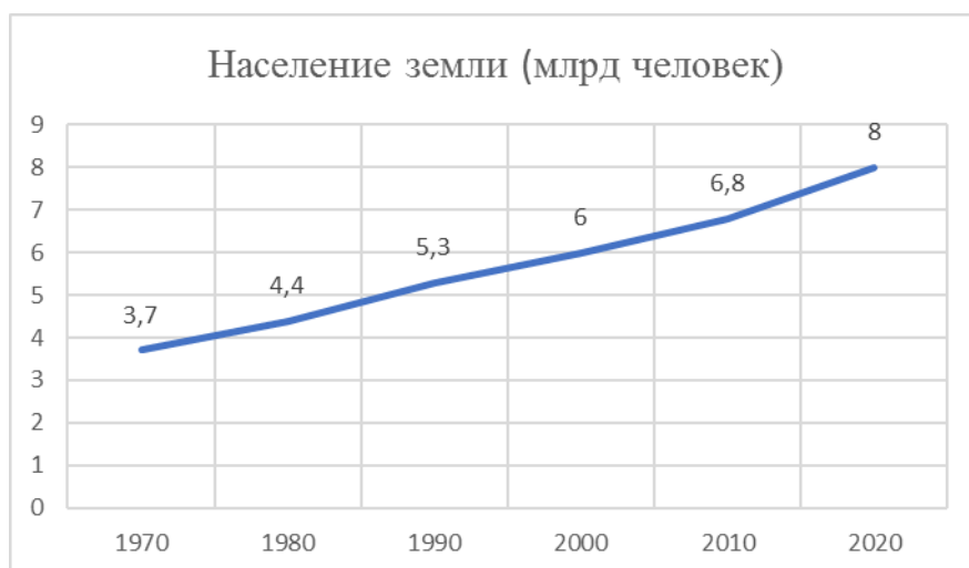
Рис. 3 Динамика роста населения земли за последние 50 лет

В то же время, несмотря на стремительный рост численности населения, благодаря научно-техническому прогрессу общемировой ВВП в расчёте на одного человека растёт ещё более стремительными темпами (рис.4). Население за 30 последних лет увеличилось менее чем в 2 раза, а ВВП в расчёте на душу населения практически в 5 раз.